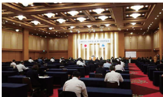
【第8回定時総会】新型コロナの感染拡大の防止のためソーシャルディスタンスを取り総会を開催しました。

公益社団法人博多法人会では、新型コロナウイルスの感染防止の観点からの「法人会活動の進め方規準」を令和2年8月26日に定め、以降はこの「進め方規準」に沿った活動を行っています。