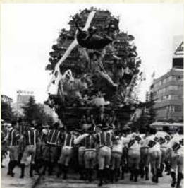
昭和45年 飾り山 祇園流

7月1日になると博多の街は山笠一色になり、街の要所を所飾り山笠が設置されます。道行く人々がその豪華絢爛な出来栄に感嘆の声をもらします。この飾り山笠とともに、街中を疾走する昇き山が人の興奮を掻き立てる約700年の歴史を持つと言われるお祭りです。博多祇園山笠の二つの山笠「飾り山」と「昇き山」の制作にあたるのが博多人形師です。本来、博多人形は土による素焼人形として知られていますが、山笠の飾り人形は木、竹、和紙、布などを材料とする細工人形です。そのルーツは永享9年(1437年)、京都から招かれた細工物師小堀家によって伝えられたとされ、博多人形師のもう一つの重要な仕事となっています。