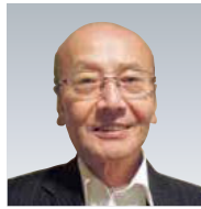
公益社団法人博多法人会会長

いたします。 ところで、御承知のとおり、消費税率の10%への引上げ及び軽減税率制度が、平成31年10月から実施されることとなっております。 私どもといたしましては、新たな制度に円滑に対応いただけるよう、様々な広報活動を行うとともに、納税者の皆様からの相談、適切かつ丁寧に対応していく所存です。 しかしながら、これらの実現は、私どもの力だけではおのずと限界があり、博多法人会の皆様方のお力添えが不可欠でございます。 引き続き、税務行政へのよき理解者として、より一層の御支援と御協力を賜りますようお願い申し上げます。 最後になりましたが、博多法人会の益々の御発展と、会員企業の皆様方の更なる御繁栄を祈念いたしまして、あいさつとさせていただきます。