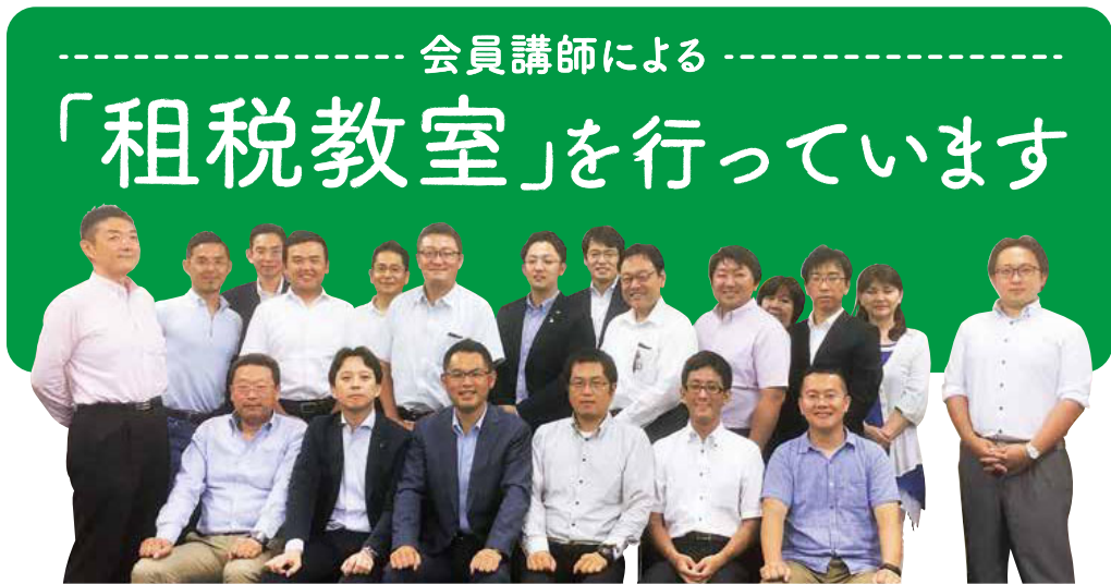
租税教室メンバー

次代を担う子どもたちに、税金が社会で果たしている役割の重要性を正しく理解してもらうため、博多法人会では、青年部会メンバーが中心となって、管内の小中学校を対象に「租税教室」を実施し、租税教育活動を行なっています。