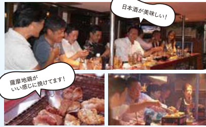
龍摩地鶏が いい感じに焼けてます!

ことでしょう。川から見ると屋台はいい眺め。ここは今から本番、博多のエネルギーの発信源となります。 春吉橋をくぐります。この橋を一日3万5千台の車と2万人の歩行者が通行します。昭和36年に架設され、老朽化に伴い現在の土流側に迂回橋建設が着工、すでに下部工事が進んでいます。迂回橋が完成すると、現在の橋を解体し、耐震性と河川の流下能力を増した新しい橋が予定されています。でも、完成後もこの迂回橋は永久橋として残され、平成32年(予定)に新たなスポット、新たな賑わい空間が創り出されます。今から待ち遠しいですね。 福岡であい橋のたもとです。5武士の街「福岡」と商人の街「博多」が出会う場所としてここで命名された80mほどの橋の中ほどには民謡「黒田