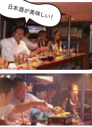
日本酒が美味しい!